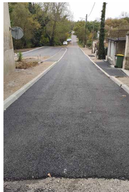
Travaux route de l'Eyre

Là aussi, les trottoirs s'élargissent, la piste cyclable se dessine dans le paysage, protégée par des végétaux d'une chaussée roulante qui tend à rétrécir. « Malgré la gêne occasionnée sur une route très passante, le chantier se passe plutôt bien », souligne Grégory Dumas, responsable du chantier mené par Eiffage. « Les riverains avaient été bien informés par la Ville et se montrent compréhensifs et constructifs dans leurs remarques. Sur le terrain, nous restons à leur disposition. » Le chantier voirie s'achèvera en mai avec, en touches finales de cette première tranche, l'installation de bancs et de mobilier urbain puis, à l'automne, la plantation des arbres et arbustes.