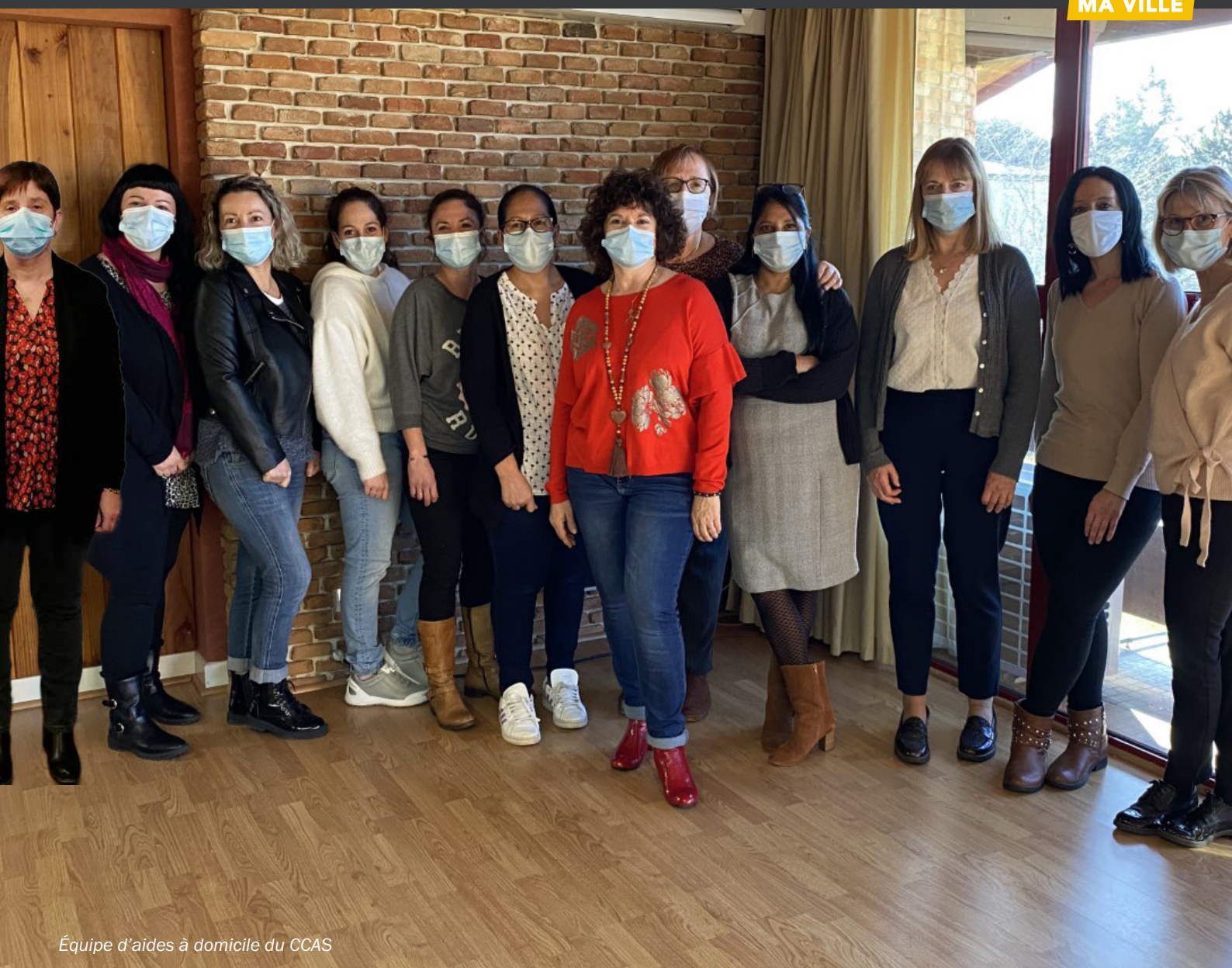
Équipe d'aides à domicile du CCAS