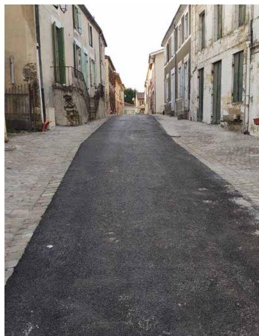
Travaux rue Sainte-Quitterie

NON PROGRAMMÉE, une phase 5 optionnelle sur le nord de l'avenue Aliénor pour faire le lien entre les deux centre-bourgs.