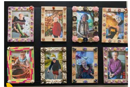
Ella, l'aide à domicile : cadres photos avec décoration de leur choix